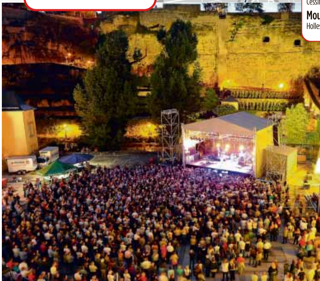
Die Abbatte de Neumünster ist Gastgeber der Abschlussfeier am 1. Juni

Basketball Dienstag bis Freitag Leichtathletik Dienstag, Donnerstag, Samstag Radsport Zeitfahren (Dienstag) Straßenrennen (Donnerstag) Mountainbike (Freitag) Judo Einzel (Dienstag) Team (Donnerstag) Tischtennis Team (Dienstag, Mittwoch) Einzel (Donnerstag, Samstag) Tennis Dienstag bis Donnerstag Schwimmen Dienstag bis Donnerstag Kunstturnen Dienstag, Mittwoch, Freitag, Samstag Schießen Luftgewehr (Dienstag) Trap/Doppeltrap (Di., Do., Fr.) Luftpistole (Donnerstag) Volleyball/Beachvolleyball Dienstag bis Samstag